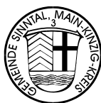
(Carsten Ullrich) Bürgermeister