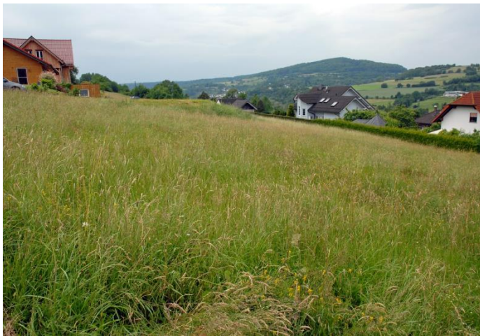
„Storchenweg“, OT Weichersbach