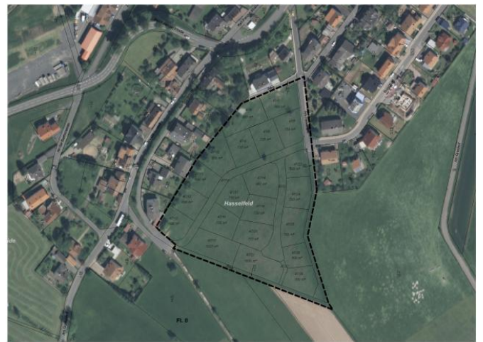
„Zum Kleerasen/Am Hasselfeld“, OT Schwarzenfels