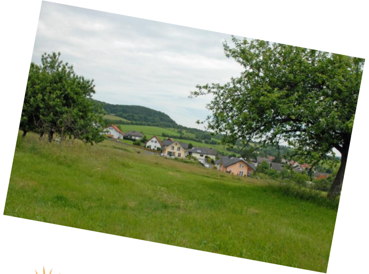
„Am Eselsbusch“, OT Breunings