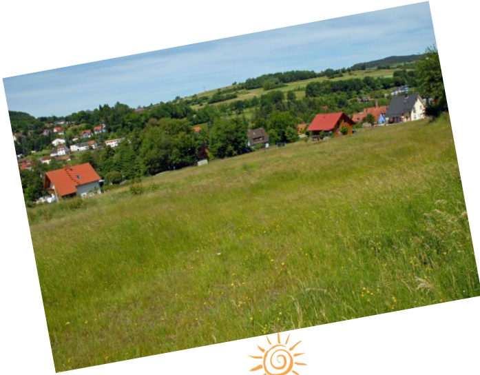
„Kirchenblick“, OT Mottgers